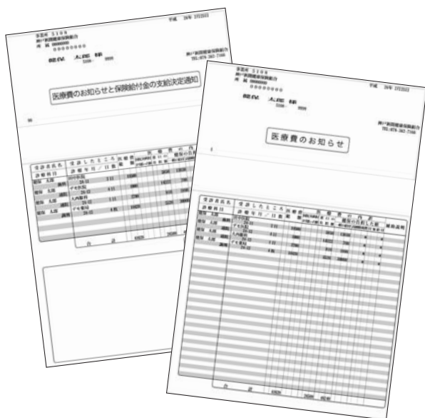
新しい医療費通知「医療費のお知らせ」と「医療費のお知らせと保険給付金の支給決定通知」

毎月発行する医療費通知「医療費と保険給付金のお知らせ」は、2月分からデザインを一新します。従来の横長の様式よりも小さいA4の三つ折りサイズ。支払った医療費などの表示が、これまでの最大8